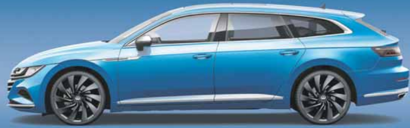
Kingfisher Blue | T Metalliclack