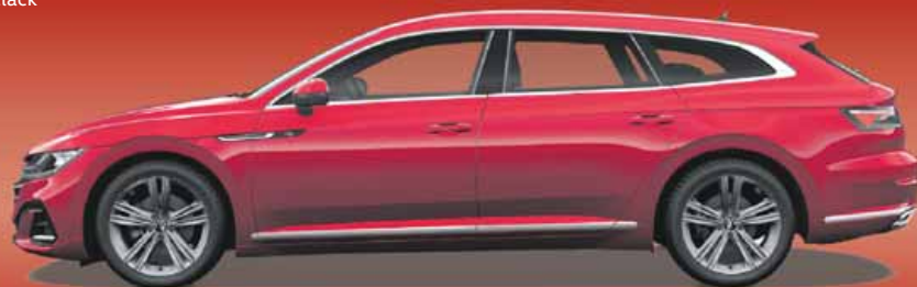
Kings Red | T Metalliclack