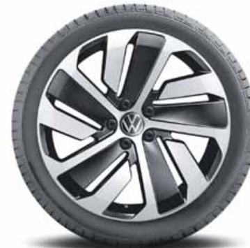
Montevideo 19" | T