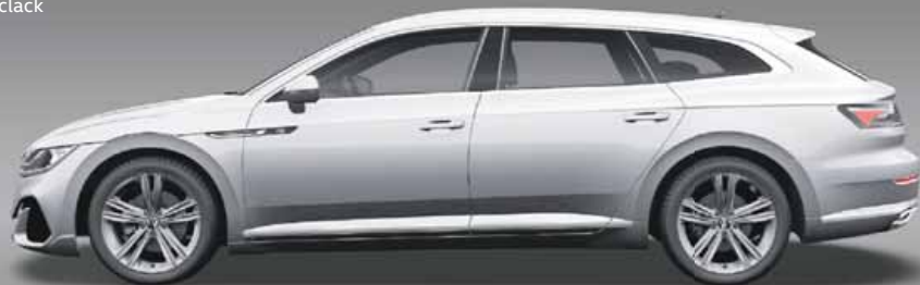
Pyrit Silver | T Metalliclack