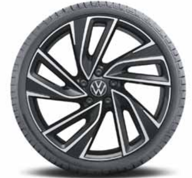
Adelaide 19" | S R