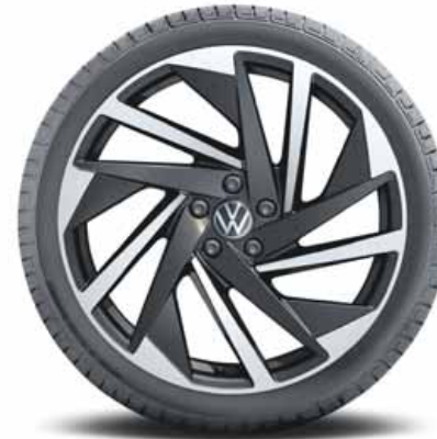
Nashville 20" | T