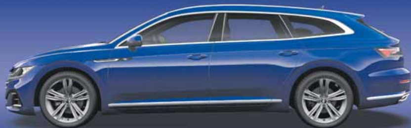
Lapiz Blue | T Metalliclack