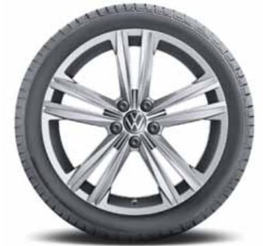
Sebring 18" | S