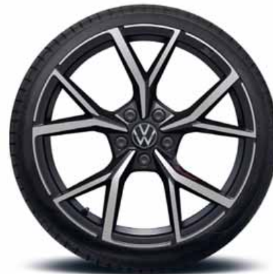
Estoril 20" | T