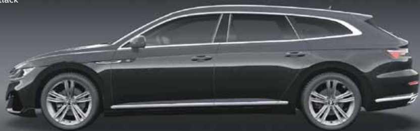
Deep Black Pearl | T Pärleffektlack